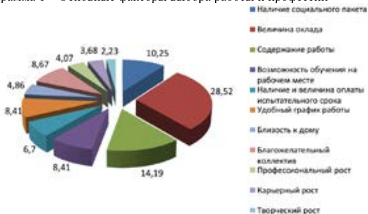
Диаграмма 1 – Основные факторы выбора работы и профессии

В рейтинге приоритетных факторов выбора молодежью профессии и работы первую пятерку составляют: величина оклада, содержание работы, наличие социального пакета, благожелательный коллектив, возможность обучения на рабочем месте, удобный график работы. Таким образом, современная молодежь более заинтересована самим процессом работы,