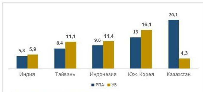
Диаграмма 1 – Соотношение уровней ранней предпринимательской активности (РПА) и устоявшегося бизнеса (УБ) в азиатских странах, в % за 2020 г.