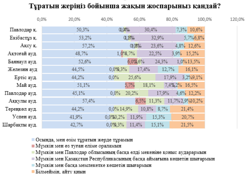
Диаграмма 3 –Тұратын жеріңіз бойынша жақын жоспарыңыз қандай?

Осылайша, қалалар мен аудандар бойынша Аққулы ауданының сұралғандардың көпшілігі – 57,4 %, Ақсу қ. респонденттері – 57,2 % және Екібастұз қ. респонденттері – 53,2 % қазіргі тұратын жерлерінде қалуды ойлайды, Аққулы ауданының сұралғандары – 6,5 %-ы, Баянауыл ауданының – 6,0 %-ы және Май ауданында сұралғандардың – 5,7 %-ы көшіп келген елге қайта оралуды жоспарлайды, Павлодар облысының басқа мекеніне көшуді Ертіс және Павлодар аудандарында сұралғандардың көпшілігі жоспарлауда – тиісінше – 25,6 % және 20,2 %, мұнда көбінде Облыс орталығы Павлодар қ. атайды, елдің басқа аймақтарына көшуді жоспарлаған сұралғандар: Екібастұз қ. – 32,9 %, Павлодар қаласы – 30,4 %, бұл жерде Нұр-Сұлтан қаласы басым. Басқа елге көшу жоспарларында бар респонденттердің басым бөлігі Успен ауданында – 15,3 % және Шарбақты ауданында – 15,1 % және Железин ауданының – 12,7 %, сұраққа жауап беруге қиналды Шарбақты ауданының респонденттері – 21,5 % және Тереңкөл ауданының – 21,4 % сұралғандар.