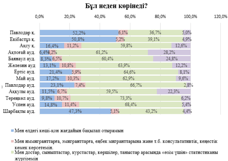
Диаграмма 2 – «Бұл неден көрінеді?» сұрақтың жауаптары көрінісі, қалалар мен аудандар бөлінісінде

Қалалар мен аудандар бөлінісінде сұралғандар арасында елдегі көші-қон жағдайын бақылайтындарын атап өткендер Павлодар қ. – 52,2 %, Екібастұз қ. – 50,8 %, Шарбақты ауданы – 47,3 %.